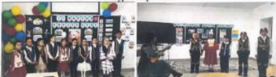
22-наурыз Ұлыстың ұлы күніне орай өтілген жұмыстардан көрініс

1-мамыр Қазақстан халықтарының бірлігі күніне орай 1-9-сыныптарда сынып сағаттары өтілді.