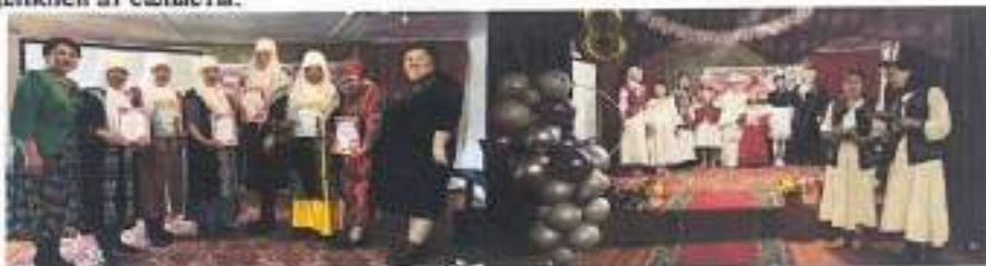
8 наурыз шарасынан

8-22-наурыз мерекесіне орай мектебімізде төмендегідей жұмыстар ұйымдастырылды. «Ана-дана, Ана-дара» хор челленджі, «Әлем аруалармен әсем» 1-4-сынып оқушыларының мерекелік құттықтауы, «Сұлы қыз, сырлы жеңге» жеңгелер сайысы, «Сұлы қыз, сырлы жеңге» жеңгелер сайысы, «Әжелер сөз – тәрбие көзі» әжелер сайысы, «Ұлттық киім – ұрпаққа мұра» ұлттық киім киюді ұйымдастырылды, «Қазақ қоғамындағы әйелдің орны» дебат ойыны, 14-наурыз – Көрісу күніне орай «Амал келді, Жыл келді» атты бірнәғай тәрбие сағаты, «Бабаларымыздан қалған асыл қазына» ұлттық ойын түрлерінен сайыс, «Ұлтымыз Ұлыстың Ұлы күнін ұлықтайды» пікірсайыс турнирі, «Күй күмбірі» республикалық домбыраншылар челленджі жоспарланып, жоспарға сай ұйымдастырылды. Қатысушы сыныптар, ата-аналар барлық шараларға аса белсенділікпен ат салысты.