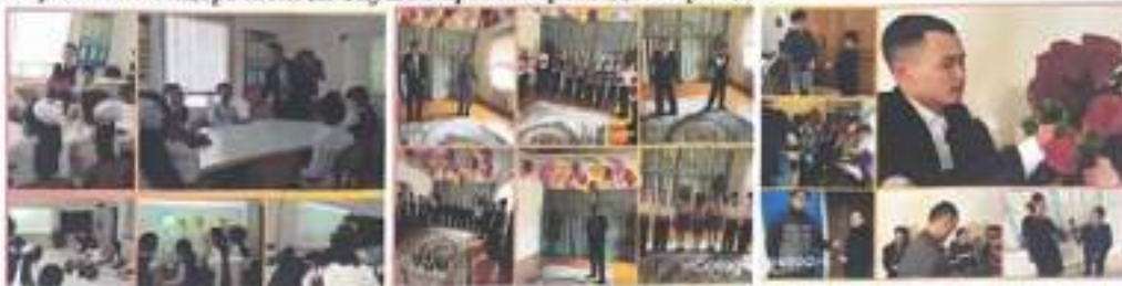
(1 наурыз – Алғыс айту күнінен фото суреттер)

ардақты ана қадірін білу және ұғындыру мақсатында «Әлем бесігін тербегетін жан - АНА» атты мерекелік концерт мектеп оқушыларымен ұйымдастырылды.