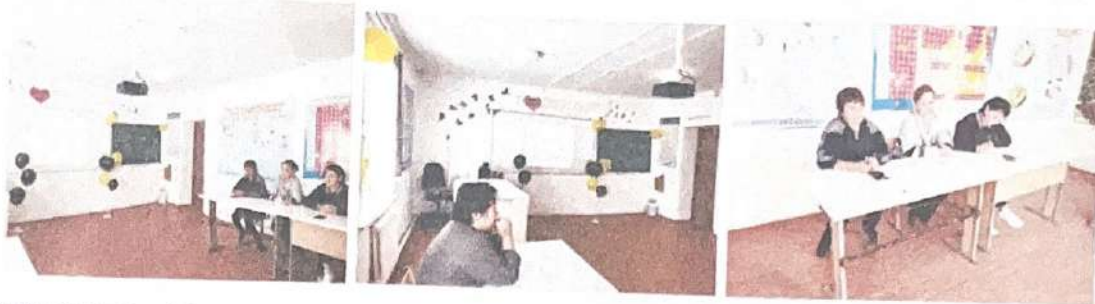
Отбасы тәрбиесі бағыты бойынша «Қарттарым - асыл қазынам» атты 1 қазан «Қарттар» күніне кездесу ұйымдастырылды.