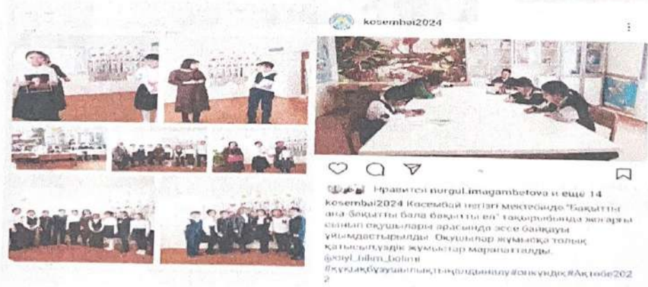
«Бүгінгі болашақ-ертеңгі маман» деген тақырыпта, студенттермен кездесу болды.