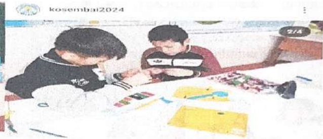
👍👍👍 Нәтижесі 79.kunduz и еңді 23 kosembai2024 "Күзгі демалыс-2022" еркін форматта сурет салу @osyl_bilim_bolimi #күзгідемалыс