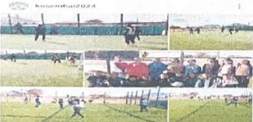
👍👍👍 Нәтижесі almatyquy.zem и еңді 24 kosembai2024 Біздің балаларымыз ақыл-ой қабілетін дағдыландыру бағдарламасын ұсынып отырмыз. Бағдарламаның мақсаты - балалардың ақыл-ой қабілетін дағдыландыру, олардың денсаулығын нығайту, олардың өмірлік дағдыларын қалыптастыру. @osyl_bilim_bolimi #almatyquy.zem