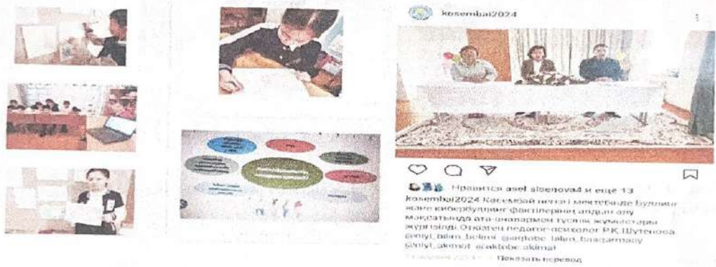
Буллинг және кибербуллинг алдын алу мақсатында ата-аналармен түсінік жұмыстары жүргізілді.