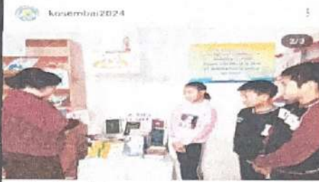
👍👍👍 Нәтижесі 29.kunduz и еңді 16 kosembai2024 Күзгі демалыс кезінде 8-сынып оқушылары ауылдық аймақтарына жетіп тұрған жана жеткендер тегін балалармен таныстырып @osyl_bilim_bolimi #күзгідемалыс #оқушытармен кездесу