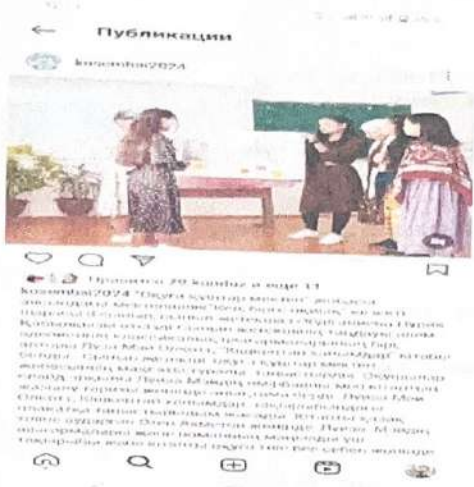
«Кибербуллинг деген не?» оны қалай түсінеміз? тақырыбы бойынша сынып сағаты өтілді.