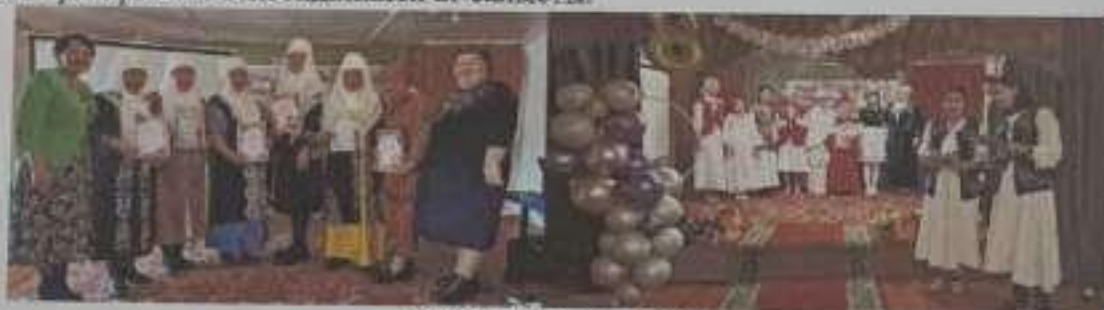
8 наурыз шарасынан

8-22-наурыз мерекесіне орай мектебімізде төмендегідей жұмыстар ұйымдастырылды. «Ана-дана, Ана-дара» хор челленджі, «Әлем арудармен әсем» 1-4-сынып оқушыларының мерекелік құттықтауы, «Сұлы қыз, сырлы жеңге» жеңгелер сайысы, «Сұлы қыз, сырлы жеңге» жеңгелер сайысы, «Әжелер сөз – тәрбие көзі» әжелер сайысы, «Ұлттық киім – ұрпаққа мұра» ұлттық киім киюд ұйымдастырылды. «Қазақ қоғамындағы әйелдің орны» дебат ойыны, 14-наурыз – Көрісу күніне орай «Амал келді, Жыл келді» атты бірыңғай тәрбие сағаты, «Бабаларымыздан қалған асыл қазына» ұлттық ойын түрлерінен сайысы, «Ұлтымыз Ұлыстың Ұлы күнін ұлықтайды» пікірсайыс турнирі, «Күй күмбірі» республикалық домбырашылар челленджі жоспарланып, жоспарға сай ұйымдастырылды. Қатысушы сыныптар, ата-аналар барлық шараларға аса белсенділікпен ат салысты.