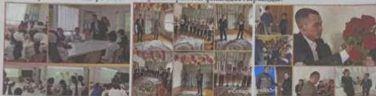
(1 наурыз – Алғыс айту күнінен фото суреттер)

1 наурыз – Алғыс айту күні 1 – 9 – сынып оқушыларымен « Алғысым шексіз!» атты жұмысы өткізілді. Ана бір қолымен бесік тербесе; екінші қолымен әлемді тербейді демекші, асыл да, ардақты ана қадірін білу және ұғындыру мақсатында «Әлем бесігін тербейтін жан - АНА» атты мерекелік концерт мектеп оқушыларымен ұйымдастырылды.