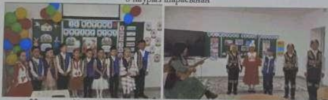
22-наурыз Ұлыстың ұлы күніне орай өтілген жұмыстардан көрініс

1-мамыр Қазақстан халықтарының бірлігі күніне орай 1-9-сыныптарда сынып сағаттары өтілді.